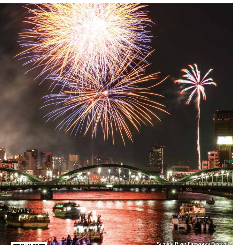
Sumida River Fireworks Festival

◀ We introduce the appeal of Taito City, especially for Muslims. Follow us on the Facebook!